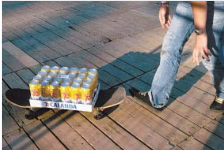
Eine junge Frau schiebt einen Karton Bier auf dem Skateboard vor sich her. (Ky)

Die Studie mache deutlich, wie schwer wiegend die Folgen des Rauschtrinkens bei Jugendlichen sein könnten, teilte die SFA mit. Die Zahl der Alkoholvergiftungen steigt ab 14 Jahren deutlich an und ist bei den 18- und 19-Jährigen am höchsten. Die Zahl der Abhängigen ist in der Kategorie der 20- bis 23-Jährigen am höchsten. (sda)