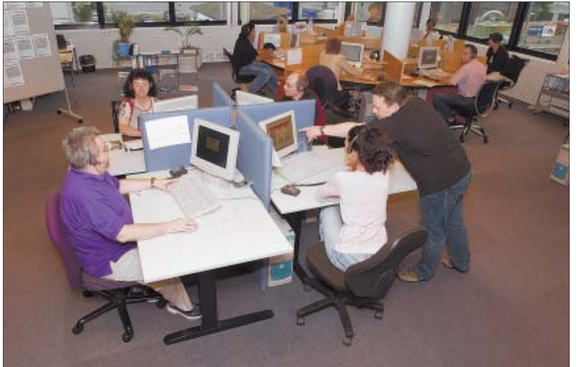
Der Call-Center-Standort Chur wird gestärkt: In den Räumlichkeiten von Grischa Call baut die RBC Solutions AG eine eigene Zweigstelle auf und schafft neue Arbeitsplätze.